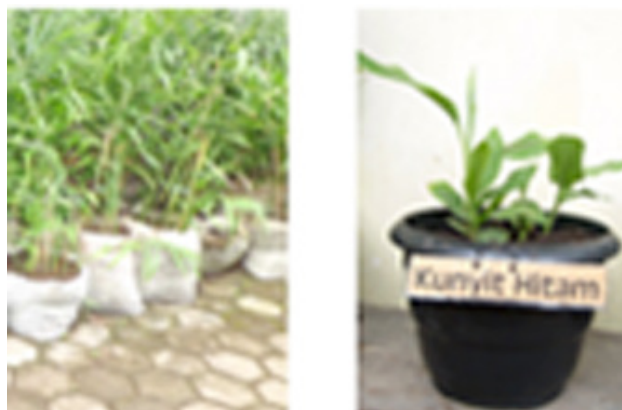
Gambar 4. Contoh Biofarmaka dalam Polybag atau Pot