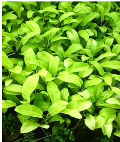
Philodendron erusbescens "golden"