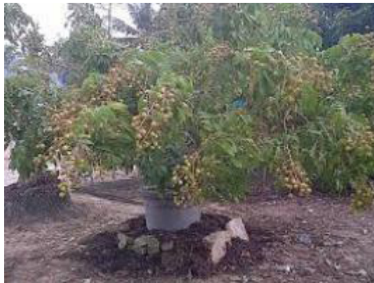
Gambar 5. Tabulampot Lengkeng Berbuah Lebat