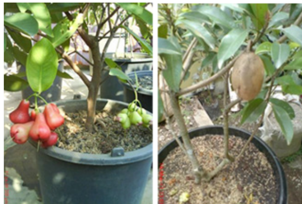
Gambar 1. Contoh Beberapa Tabulampot Buah