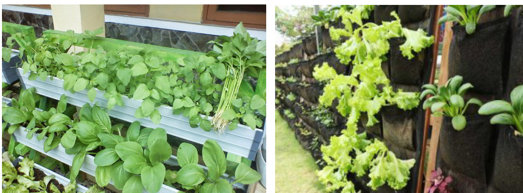
Gambar 11. Vertikultur Tanaman Sayur