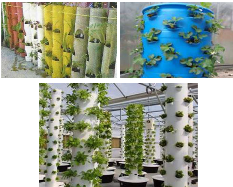
Gambar 8. Contoh Vertikultur Jenis Tabung