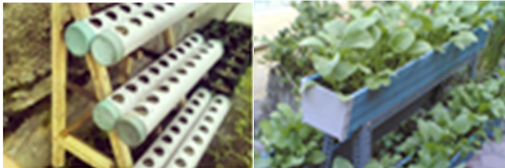
Gambar 7. Contoh Vertikultur Jenis Rak