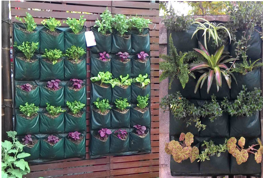
Gambar 10. Ilustrasi Pot Kantong sudah ditanami