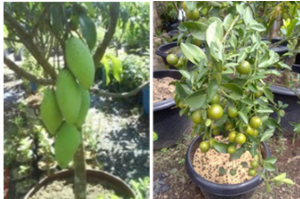
Gambar 2. Contoh Beberapa Tabulampot Buah