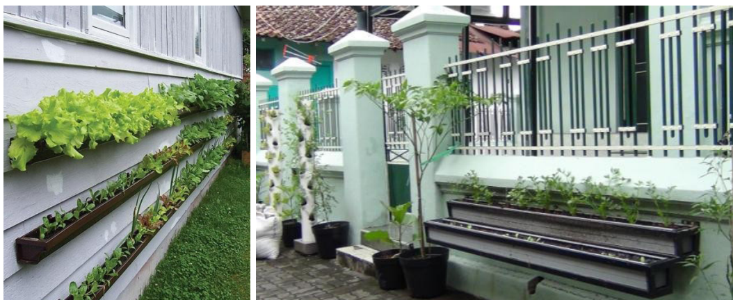
Gambar 9. Ilustrasi Vertikultur dari Talang Air