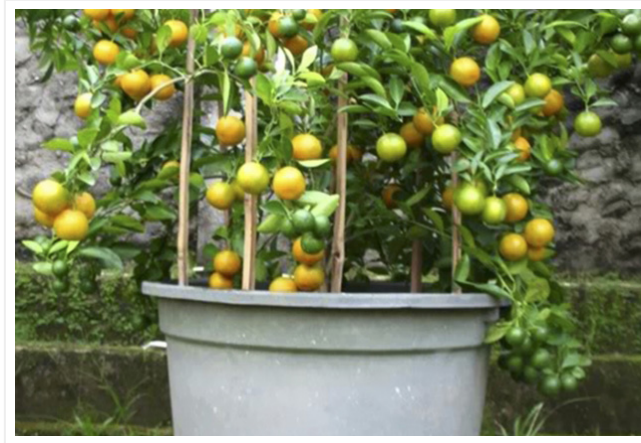
Gambar 6. Tabulampot Jeruk berbuah Lebat