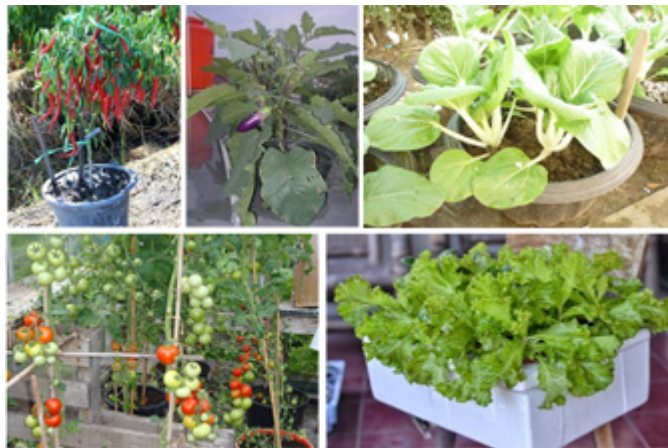
Gambar 3. Contoh Beberapa Tanaman Sayuran dalam Pot