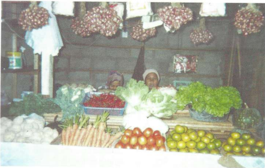
Jenis sayuran di Pusat Sayuran Organik.

dibuat dari sejenis predator. Triko berfungsi dapat mempercepat proses pembusukan. Hasilnya dalam 15 hari kompos jadi hancur, dan dalam 21 hari sudah dapat dipakai. Triko ini dapat dibuat sendiri, dari 1 kg biang bisa menjadi 5-6 kg. Bantuan Pemda Batusangkar dalam pembuatan kompos adalah dalam pengadaan mesin kompos. Pada setiap kecamatan terdapat mesin kompos. Sedangkan untuk pemasaran lokal, Pemda membangun Pusat Sayuran Organik ditepi jalan Padang Panjang, Bukittinggi. (FS)