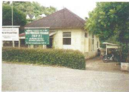
BPP, kelembagaan petani di desa.

Tujuan dari Forum Koordinasi Pimpinan Kelembagaan Penyuluhan Pertanian adalah (1) tercapainya persepsi yang sama tentang