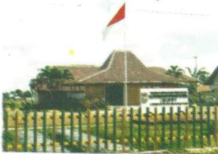
BIPP, salah satu bentuk kelembagaan penyuluhan

Berdasarkan data Pusat Pengembangan Penyuluhan Pertanian, Badan SDM Pertanian terdapat 7 bentuk kelembagaan penyuluhan di daerah yaitu bentuk Kelompok Jabatan Fungsional, Sub Dinas, Kantor, BIPP, UPTD, seksi, dan bentuk Badan (eselon II).