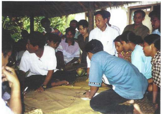
Proses money partisipatif

Sampai pada tahun kedua dari empat tahun jangka waktu proyek, untuk tahun anggaran 2001 sebagian besar kabupaten di lokasi DAFEP menerima dana proyek pada