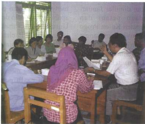
Kegiatan IKL oleh BIPP Wonocatur di BIPP Kulon Progo

oleh Kabupaten Kulon Progo dalam menyelenggarakan penyuluhan pertanian termasuk DAFEP bukan tidak mempunyai permasalahan, namun beberapa