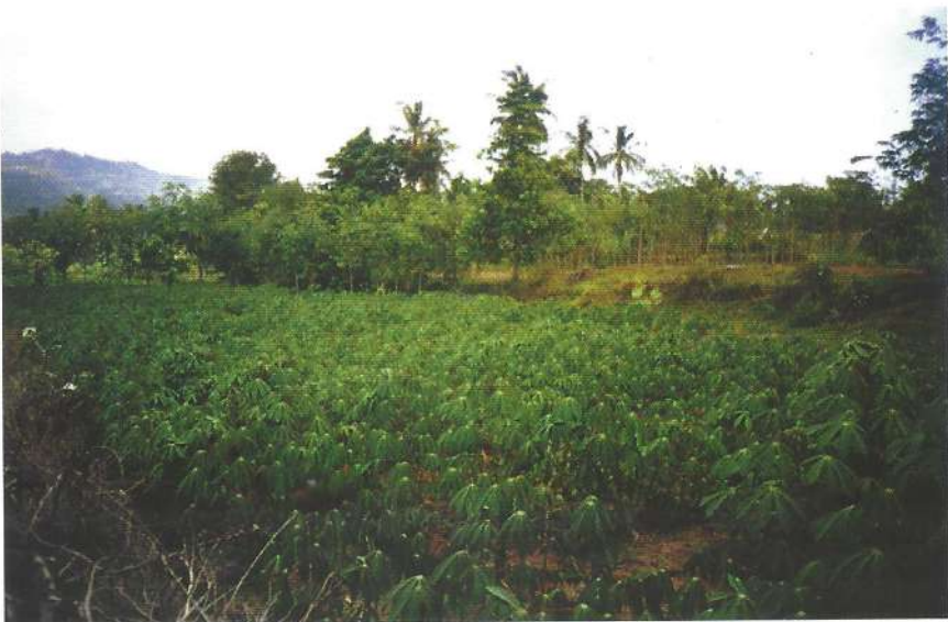
Potensi sumber daya alam yang menjanjikan

Arah pengembangan pertanian tersebut sejalan dengan Visi Pembangunan Kabupaten Simalungun yang mandiri, sejahtera melalui pemberdayaan ekonomi kerakyatan dan institusi yang prima pada 5 (lima) tahun mendatang. Sedangkan Misi Pembangunan, adalah : (1) Meningkatkan hasil pertanian dan perkebunan melalui diversifikasi, intensifikasi dan rehabilitasi, serta menggali dan memantapkan obyek-obyek wisata, (2) Meningkatkan kualitas sumber daya manusia bidang pertanian, pariwisata dan perkebunan, (3) Meningkatkan pendapatan daerah dan masyarakat di