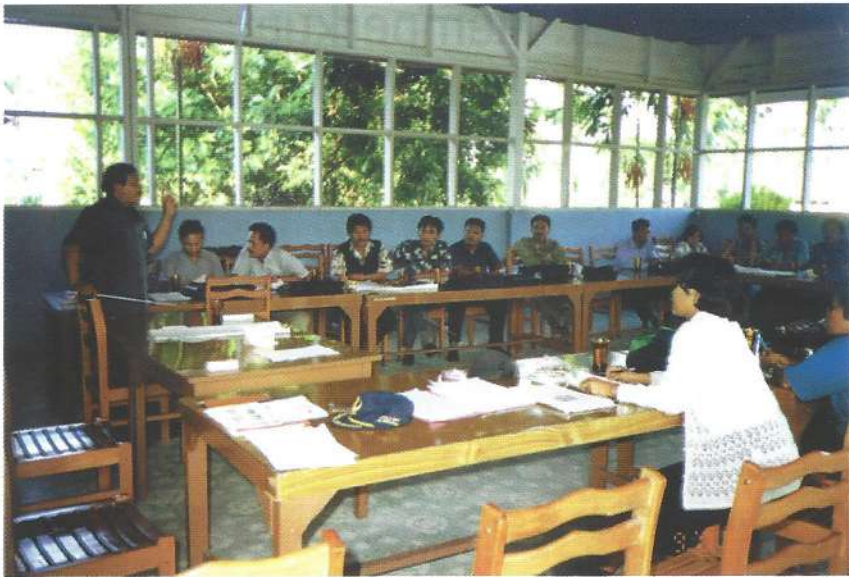
Kepala KIPPK Kab. Simalungun "Peningkatan Kemampuan aparat penyuluhan adalah penting"!