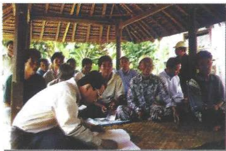
Petani berpartisipasi aktif dalam kegiatan penyuluhan