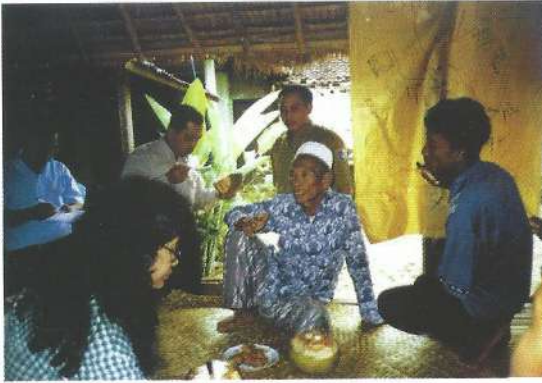
Wawancara dengan anggota rumah tangga

manajemen sumberdaya pada setiap rumah tangga, dan memberikan kesempatan kepada responden yang bersangkutan untuk mempelajari hubungan antara rumah tangganya dengan sistem sosial, ekonomi, dan ekologi tempat mereka tinggal. Dalam hal ini, pendapat kedua belah pihak baik perempuan maupun laki-laki perlu didengar, kendati biasanya lebih mudah memperoleh pendapat laki-laki daripada perempuan. Metode ini hendaknya dilakukan terhadap sekurang-kurangnya separuh dari jumlah responden yang terdiri dari perempuan, agar secara nyata dapat dilihat perbedaannya (disparitasnya).