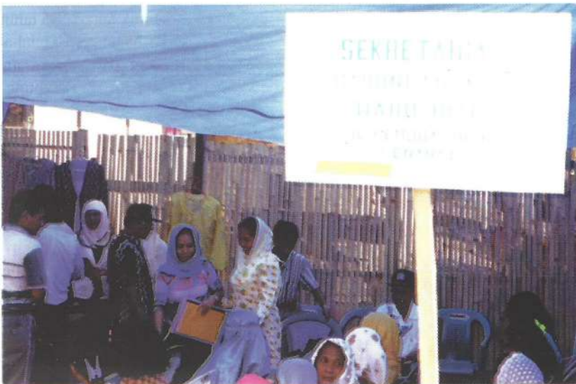
Kegiatan Gabungan Kelompok Wanita tani “Waru Rite”

Untuk menunjang berbagai kegiatan para anggota kelompok-kelompok wanita dalam GKW membentuk badan pengurus dan koordinator bidang, Adapun susunan struktur organisasinya adalah terdiri dari 1) Ketua, 2) Sekretaris, 3) Bendahara, selanjutnya dibentuk masing-masing koordinator bidang atau unit usaha, yaitu 1) Kerajinan dan Tenunan, 2) Agribisnis dan Usaha bersama, 3) Produksi, 4) Pemasaran, Sosial dan Agama, 5) Simpan Pinjam. (Ru)