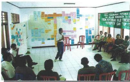
Hasil pengamatan potensi desa berupa perencanaan kegiatan desa yang disampaikan dalam suatu pertemuan tingkat desa