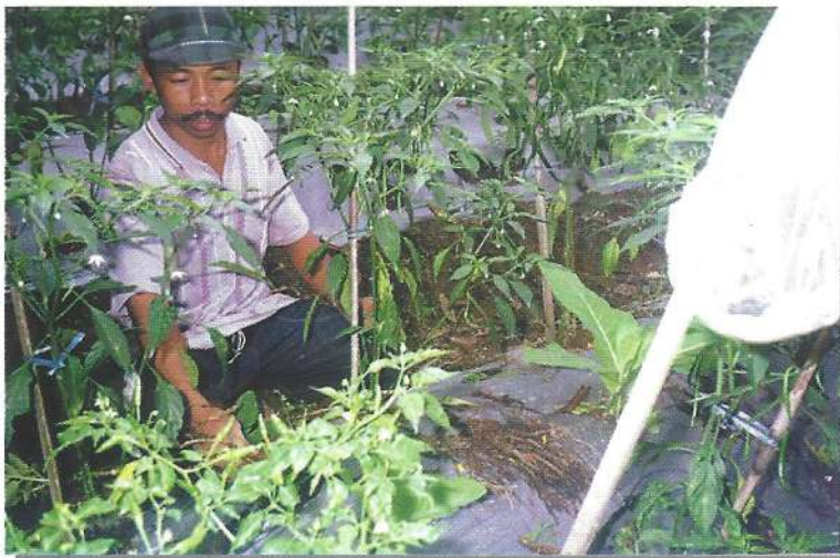
Petani sudah mampu melakukan uji coba di kebun sendiri