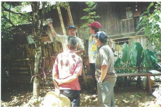
DAFEP mempertemukan PPL dan PKL di lapangan

Pendek kata bila selama ini, substansi kehutanan didalam Proyek ini tidak begitu menonjol atau kurang perhatian itu memang benar adanya, hal ini bukan hanya dirasakan oleh saudara-saudara kita yang berada di Departemen Pertanian melainkan sangat dirasakan oleh kami yang berada di Departemen Kehutanan. Namun kami yakin ke depan layar telah dikembangkan, tinggal kemana kemudi akan selalu diarahkan,