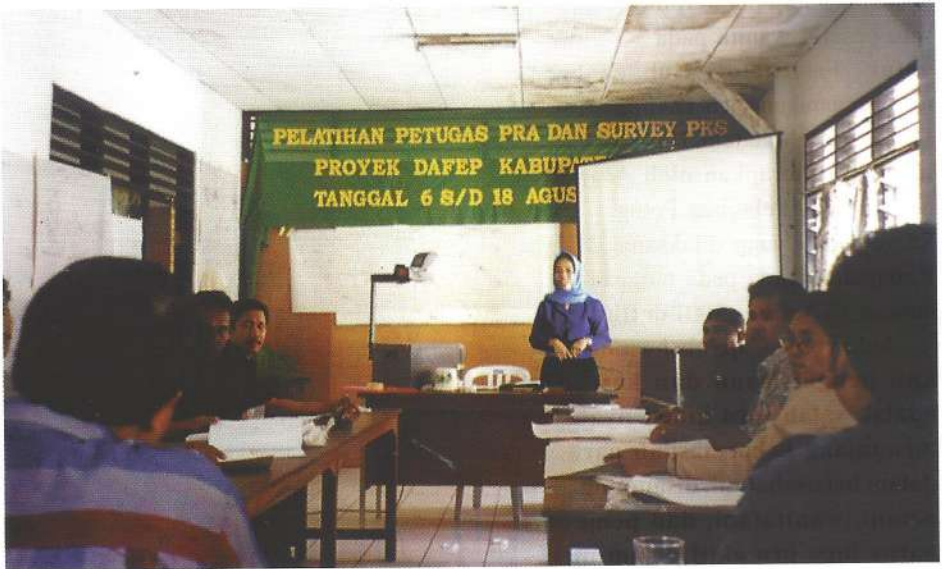
Salah satu bentuk “capacity building” wanita tani

Menurut Aida, setiap suatu kegiatan usahatani tidak akan pernah jauh dari permasalahan dan tantangan yang timbul. Dalam menghadapi segala masalah yang dihadapi ia selalu mengajak para pengelola unit-unit usaha di bawah GKW “Waru Rite” untuk berdiskusi untuk memecahkan permasalahan yang dihadapi dan menganjurkan untuk senantiasa bermental baja dan tahan banting, karena bagi para anggotanya tidak ada istilah putus asa, kita harus belajar dari suatu kegagalan untuk