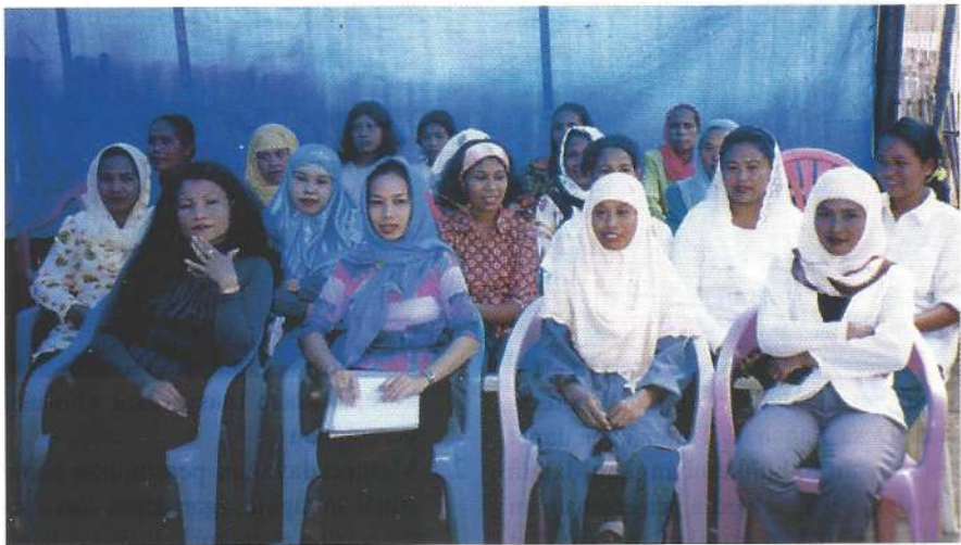
Sedang mendengarkan pembekalan dari Tim BIPP Bima