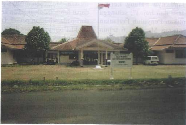
BIPP Kab. Magelang

Euphoria kebebasan yang sedang terjadi di sebagian besar Kabupaten/Kota di seluruh wilayah negara kita ini, ternyata oleh Pemerintah Kabupaten Magelang