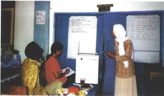
Jender membuka wawasan tentang kesetaraan pria dan wanita

Pembaca, kisah di atas bukan karangan belaka, melainkan sebuah pertemuan Organisasi Pangan dan Pertanian Perserikatan