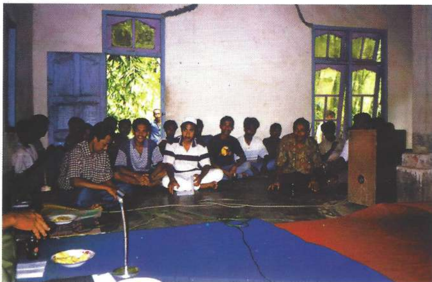
Pertemuan dengan Kelompok Tani