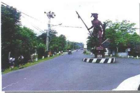
Kab. Bolaang Mangondow salah satu Kab. yang telah menerapkan desentralisasi penyuluhan