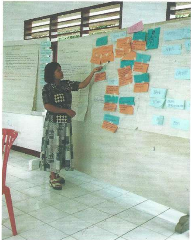
Prinsip belajar melalui pengalaman

Sebagai penutup, sajian tulisan ini dimaksudkan untuk menerapkan salah satu prinsip PRA yang sedang dirintis oleh DAFEP, yakni prinsip belajar dari kesalahan. Penerapan prinsip ini ialah dengan cara mencari dan menemukan kesalahannya agar dapat diperbaiki di masa mendatang dan menghindarkan terjadinya pengulangan kesalahan yang sama dua kali. Semoga ada manfaatnya. Kita sudah melangkah dan pantang untuk surut kembali. (Zz)