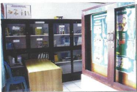
Perpustakaan sumber informasi