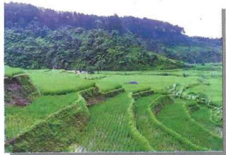
Pertanian dan Kehutanan salah satu penyumbang pendapatan asli Kab. Bolaang Mangondow