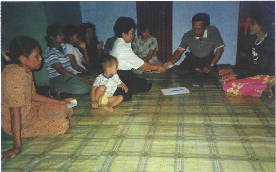
Salah satu kegiatan KPK

Lembaga KIPPK akan efektif dan efisien kalau dilengkapi satu seksi Ketahanan Pangan; Kerjasama dengan IP2TP dan ARM dalam rangka pemberdayaan petani-nelayan dan transfer of technology/teknologi tepat guna akan ditingkatkan. (Sh)