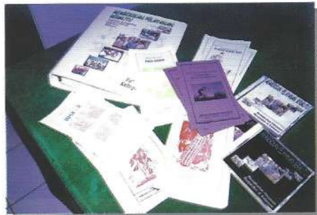
Informasi praktis sangat dibutuhkan petani