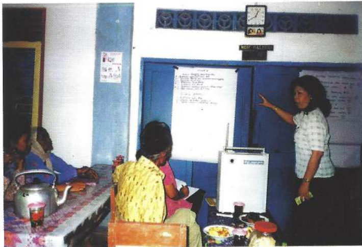
Pimpro DAFEP Pusat berinteraksi dengan petani sasaran

penyuluhan partisipatif oleh kelompok kerja pelatihan DAFEP di pusat;