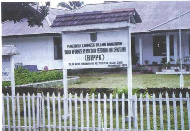
Institusi Penyuluhan semakin kuat dengan bentuk lembaga BIPPK

orang berjalan tanpa tahu ke mana akan pergi. Seorang penyuluh sebelum memulai kegiatannya, seharusnya tahu tujuan apa yang akan dicapai! Dan mem-