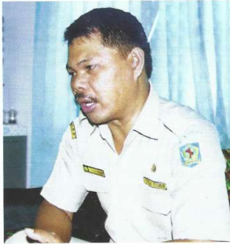
Ka. BIPPK Bolaang Mangondow

dengan berbagai pihak untuk menciptakan ruang yang lebih terbuka dalam bekerja sama menumbuhkan jejaring kerja yang lebih luas untuk memberikan pelayanan yang lebih bulat sesuai dengan apa yang dibutuhkan petani dan masyarakat tani di pedesaan. Dengan harapan mampu melahirkan iklim yang lebih kondusif bagi pengembangan usaha disertai dengan berkembangnya sumberdaya manusia yang lebih berkualitas, yang lebih cerdas, yang mempunyai ambisi untuk melakukan perubahan ke arah yang lebih baik dan lebih maju (Aa).