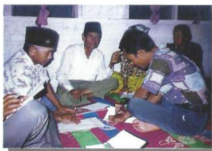
Penyuluhan partisipatif diawali dengan pemahaman potensi desa melalui metoda PRA