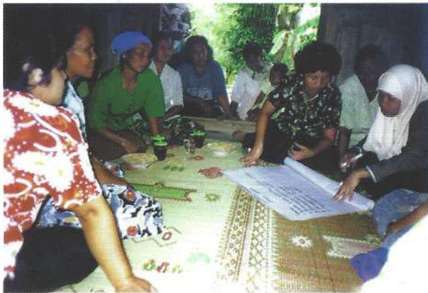
Untuk mengejar ketertinggalannya, perempuan terus belajar

diskusi dengan perempuan dan/atau laki-laki dewasa yang mewakili rumah tangga yang bersangkutan ini, ditujukan untuk mengungkapkan peran jender dalam