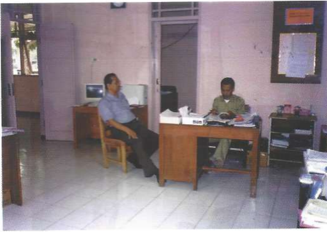
Konsultasi DAFEP berdiskusi dengan Pimpinan DAFEP Kab. Magelang

oleh BIPP, mempunyai tugas pokok adalah mendidik agar mampu mengelola usahatani agribisnis yang berwawasan lingkungan untuk meningkatkan keberdayaannya, meningkatkan pendapatan dan kesejahteraan. Beberapa langkah yang telah dilakukan oleh BIPP Magelang, disamping bimbingan teknis atau teknologi budidayanya untuk meningkatkan produktivitasnya, bimbingan dan pembinaan pasar menjadi kunci pokok keberhasilan petani.