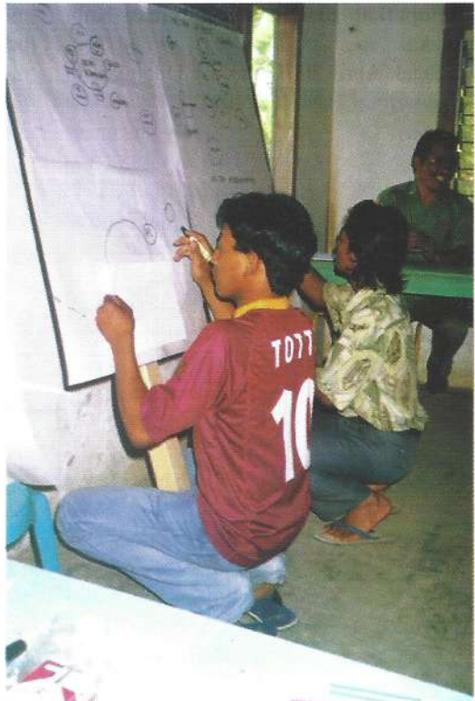
DAFEP menyertakan pemuda tani dalam kegiatannya

Demikian juga materi “Peta mobilitas” dirasa petani banyak manfaatnya. Contohnya, sebelum mengikuti pelatihan, sewaktu petani berhubungan dengan pihak luar, baik itu untuk berobat, ke pasar atau yang lainnya, ia tidak mengingat-ingatnya dan mencatatnya. Namun setelah mengikuti pelatihan, apa yang mereka lakukan dengan pihak luar itu diingat dan dicatatnya untuk disesuaikan dengan usahatani yang mereka lakukan.