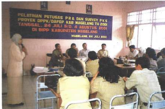
Pelatihan TOT PRA bagi petugas

usahanya dan melaksanakannya yang difasilitasi oleh Penyuluh Pertanian dan aparat lainnya untuk mengembangkan usahanya dan meningkatkan pendapatan dan kesejahteraan.