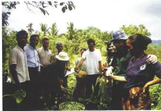
Menyaksikan petani panen