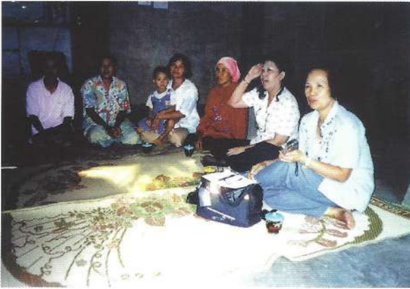
Kunjungan di rumah petani