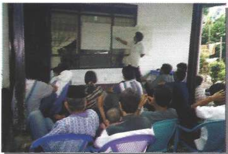
Petani bersama-sama petugas melakukan monitoring dan evaluasi di tingkat desa