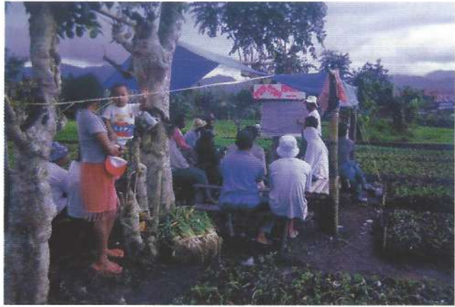
Penerapan teknik analisis Jender dalam penyuluhan

Metode tersebut di atas pada dasarnya dapat diterapkan dalam kegiatan penyuluhan baik penyuluhan pembangunan maupun penyuluhan pertanian dalam arti luas atau penyuluhan agribisnis sekalipun, karena penyuluhan merupakan salah satu subsistem dari sistem pembangunan. Hasil dari penerapan metode itu, tentunya