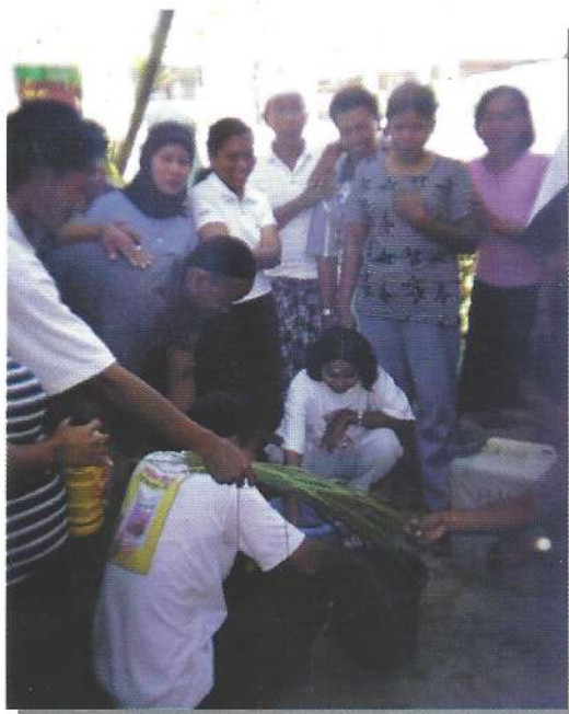
Dengan dibantu petugas, petani melakukan pengambilan sampel tanah untuk menentukan dosis pupuk yang tepat