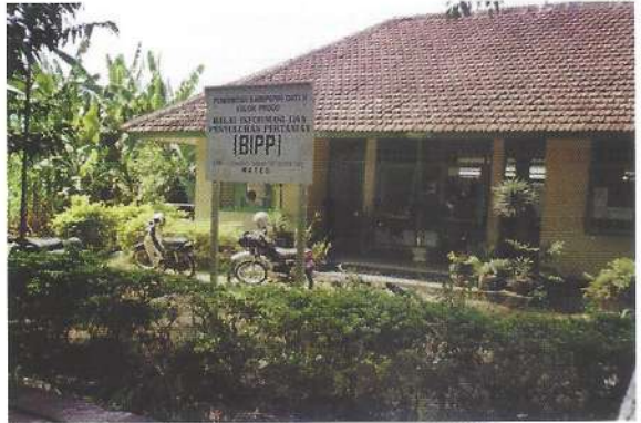
BIPP Kulon Progo

Gambaran seperti yang dilukiskan oleh pepatah diatas tersebut, mungkin tidak dapat disamakan dengan kasus BIPP Kabupaten Kulon Progo. Pejabat Pemerintah Kabupaten, Pengelola BIPP dan Penyuluh Pertanian Kulon Progo mempunyai pendapat yang berbeda dengan pepatah tersebut, karena kepeduliannya terhadap petani untuk memberdayakannya dalam membangun Daerahnya. Berikut dilaporkan pendapat-pendapat dari Asisten II Sekwilda Kabupaten Kulon Progo, Kepala BIPP, dan Penyuluh Pertanian tentang upaya untuk memberdayakan petani di kabupaten Kulon Progo yang sempat diwawancarai di tempat