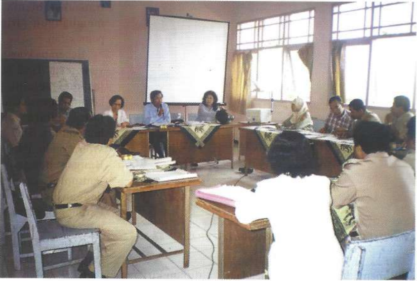
Kunjungan Wakil Bank Dunia dan Pimpinan DAFEP ke Kab. Magelang

pasar agribisnis yang omzetnya besar maka para petani baik secara perorangan maupun secara berkelompok dapat dengan mudah memasarkan produknya. Dengan dibangunnya jaringan pasar yang dekat dengan petani, akan lebih menguntungkan petani, sehingga petaninya lebih mudah digerakkan untuk dapat meningkatkan produktivitas yang dapat meningkatkan pendapatan dan kesejahteraannya.